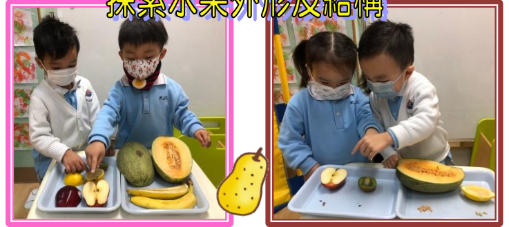
分享我最喜歡的水果及食物