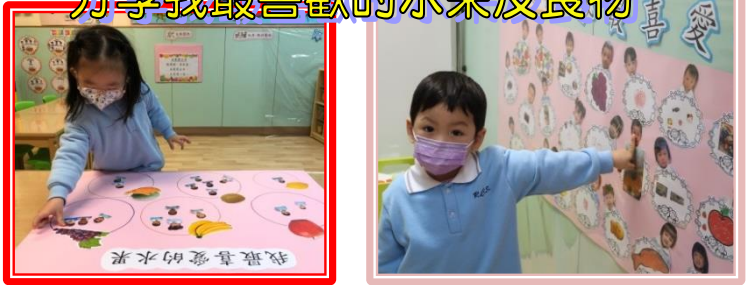
分享我最喜歡的水果及食物