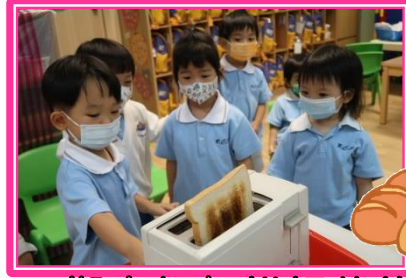
觀察麵包烘焗後的變化

幼小班在「認識自己」的主題中，透過不同活動進行探索，如：觀察麵包在烘焗前後的變化，認識身體不同部位的名稱及用途，以及認識五官的名稱及位置，並運用五官去辨別不同樂器的聲音及食物的氣味等。此外，又在幻想角內模擬浴室的情景，讓幼兒認識清潔身體的方法，學習做個乾淨的小寶寶呢！