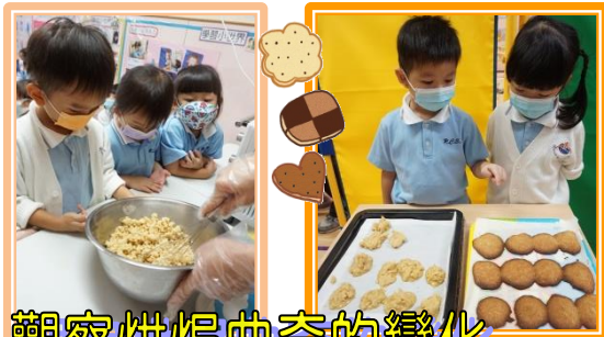
觀察烘焗曲奇的變化