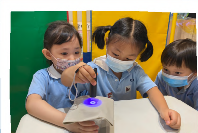
觀察及測試各種防曬用品