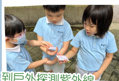
到戶外探測紫外線