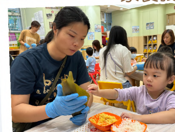
家長義工教幼兒包粽子